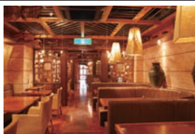
●洋室 (テーブル) /80席

(営業時間) 11:00~22:00 (LO) 〈平日15:00~17:00クローズ〉 (洋室) 80席 (和室) 80席 (駐車場) 近隣駐車場有