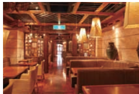
●洋室 (テーブル) /80席