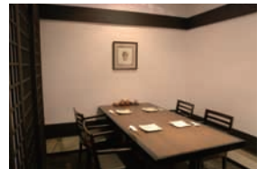
●洋室 (テーブル) /40席

(洋室) 40席 (和室) 60席 (駐車場) 有 送迎車もご用意できます(要予約)