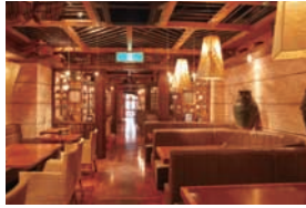
●洋室 (テーブル) /80席