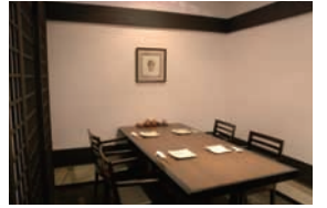
●洋室 (テーブル) /40席

(洋室) 40席 (和室) 60席 (駐車場) 有 送迎車もご用意できます(要予約)