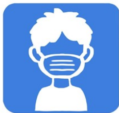
スタッフのマスク着用