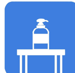
入り口でのアルコール消毒