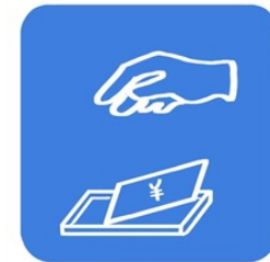
お会計時のトレイ使用