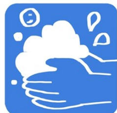
スタッフの手洗いうがい